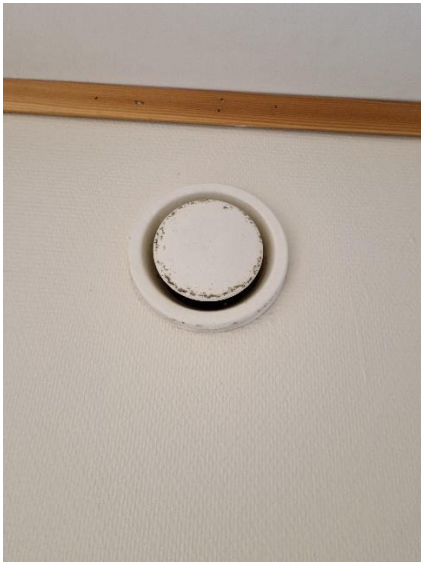
Avtrekk kjøkken (vegg)