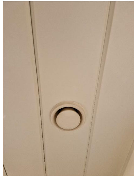
Avtrekk bad (tak)